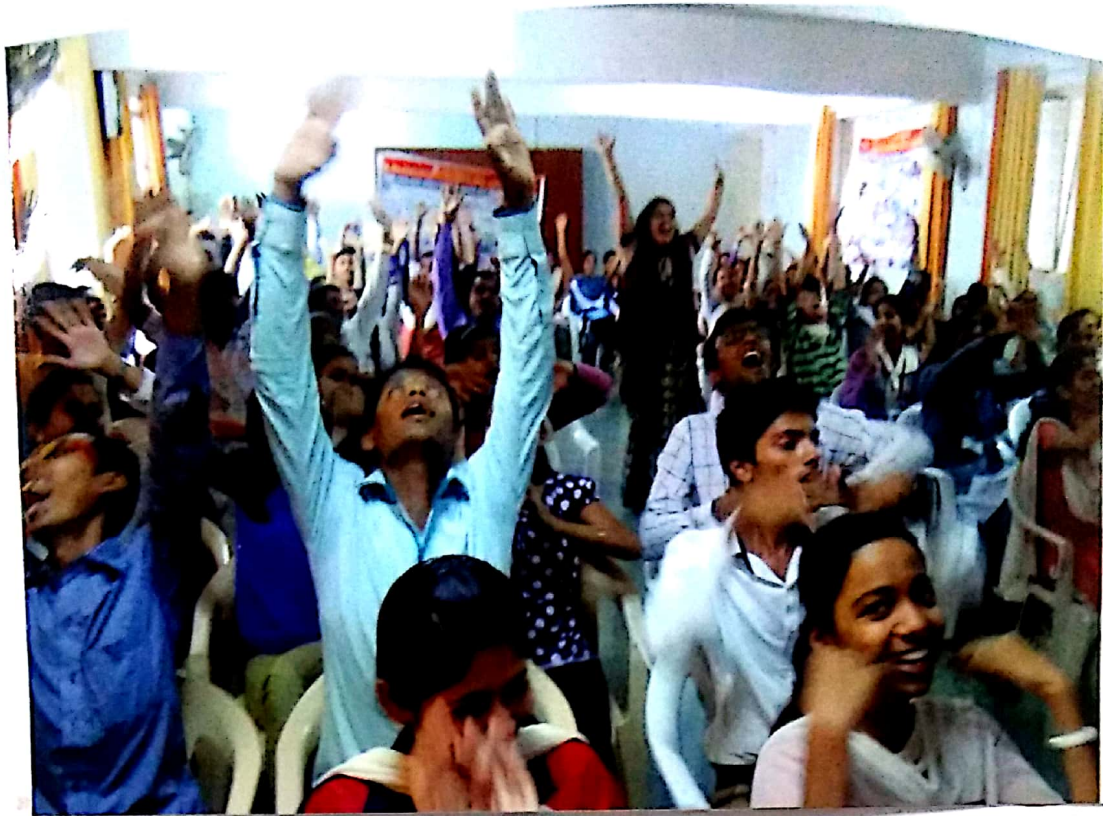
Laughing activity in workshop on leadership Development - Academic year 2014-15