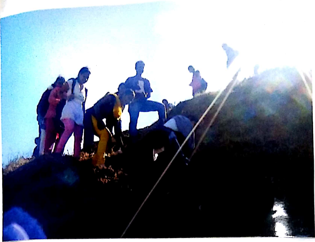
District level trekking camp.