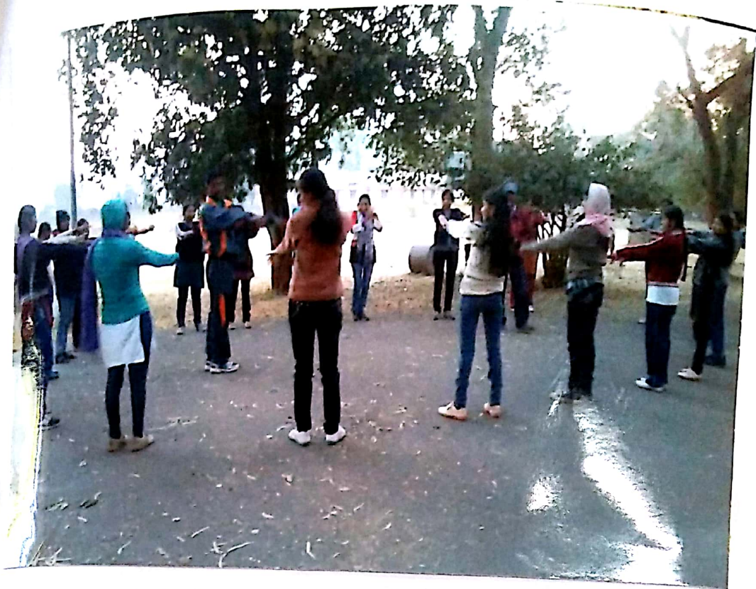
Activity Conducted in Nirbhay Kanya Abhiyan